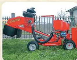
Braccio di lavoro telescopico Bras de coupe télescopique