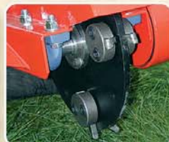
Disco ad 8 utensili "Carbide" Tête à 8 pointes "Carbide"