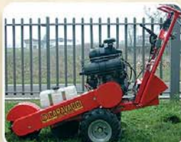
Manubrio regolabile in altezza Mange réglable en hauteur