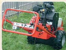
Leggera e molto facile da usare Très léger et très facile à utiliser