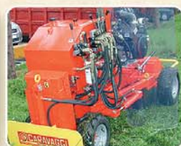
Leve di comando situate in posizione centrale Position centrale des leviers de commandes